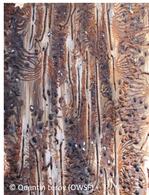
Figure 5: Galeries caractéristiques de l' Ips typographus : la galerie maternelle est verticale, les galeries des larves sont relativement horizontales.

Les premiers symptômes observables sont les trous d'entrée . Leur densité est souvent assez faible. Ces trous sont dispersés sur l'écorce et sont relativement difficiles à repérer. Par contre, la sciure des galeries maternelles évacuée par les insectes durant le forage est bien visible. Elle se retrouve au pied des arbres ou sur leur écorce, ce qui permet également de repérer les arbres atteints. Des écoulements de résines importants sont régulièrement visible à ce stade.