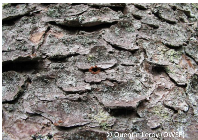
Figure 4: un trou d'entrée avec de la sciure sur épicéa

Une attaque de typographe entraîne presque irrémédiablement la mort des arbres touchés. Le développement des larves et l'élongation de leurs galeries détruisent progressivement le système vasculaire de l'épicéa. La mort de l'arbre intervient dans les semaines ou mois suivant le développement des scolytes sous l'écorce. Les arbres de plus de 60 cm de circonférence représentent la population la plus sensible.